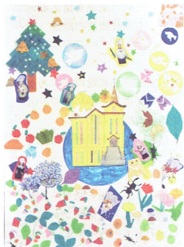
「かみさまのみわざ」 ～横浜海岸教会の一年