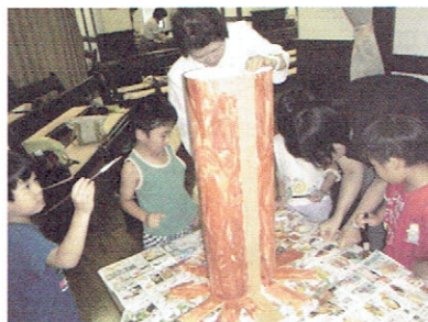
最近の制作風景： 「からしだねのたとえ」(立体)

横浜海岸教会公式HPにて掲載作品のカラー画像を公開中です。 御覧頂けましたら幸甚に存じます⇒ http://www.kaiganchurch.or.jp/