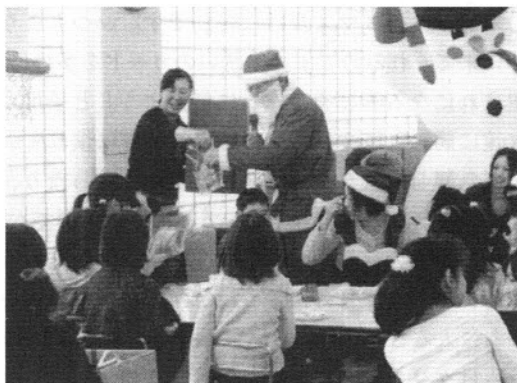
祝会の最後は大盛り上がり！