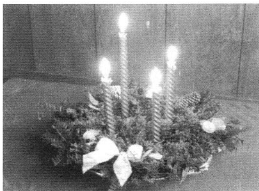
アドベントクランツに火を灯すと 気持ちが高まります