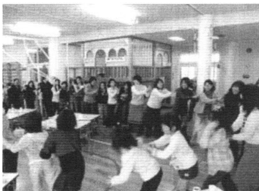
みんなで楽しむ祝会